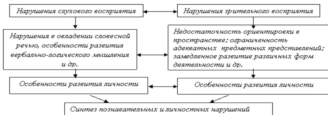
Рис. 2. Структура комплексного (сложного) нарушения при слепоглухоте

Множественное нарушение – это сочетание трех и более первичных нарушений, каждое из которых имеет отрицательные последствия, усугубляющие отклонения в развитии ребенка (например, умственно отсталые слепоглухие).